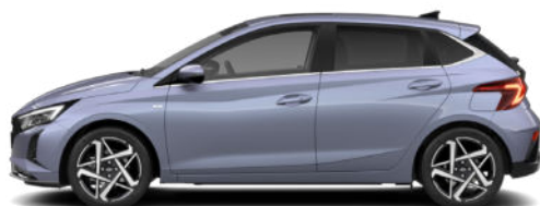
Meta Blue Pearl Kontrastdach verfügbar