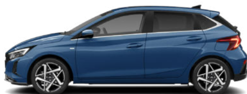
Vibrant Blue Pearl Kontrastdach verfügbar