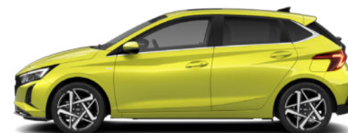
Lucid Lime Metallic Kontrastdach verfügbar