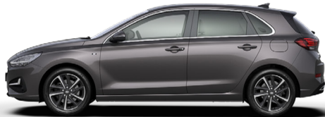
Dark Knight Gray Pearl