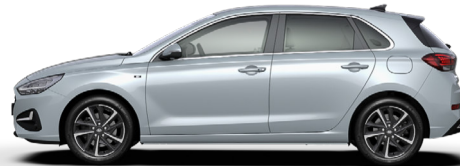
Shimmering Silver Metallic