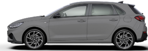
Shadow Gray nur für N Line