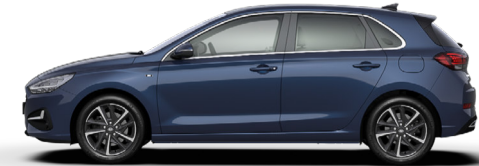
Dark Teal Metallic