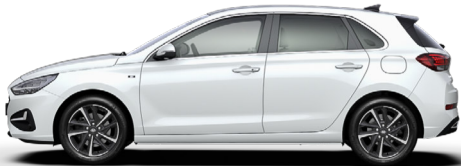
Serenity White Pearl